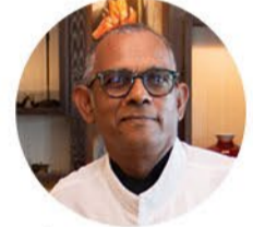
Nizam Peeroo Labourdonnais Waterfront Hotel